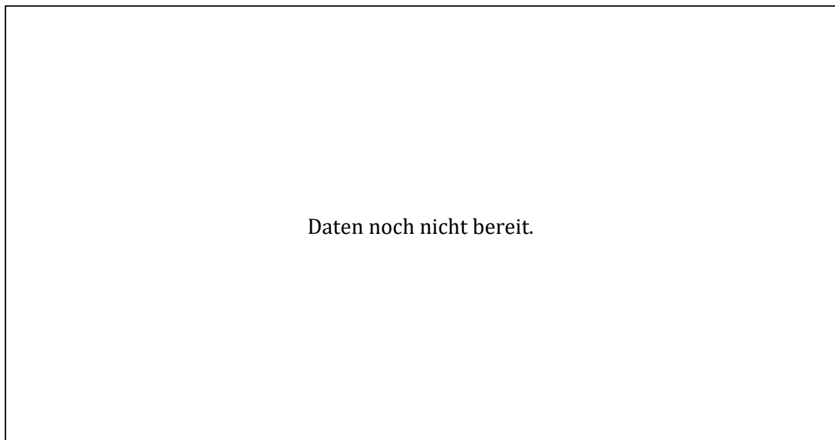
Abbildung 1 zeigt mit der roten durchgezogenen Linie den Verlauf des Grundwasserspiegels [m ü. M.] aus den Daten des Loggers (1 Messung pro Tag). Die gestrichelte graue Linie steht für den langjährigen Trend dieser Daten. Die hellblauen Balken zeigen den Niederschlag [mm/m 2 ] als Wochensumme (agrometeo.ch).